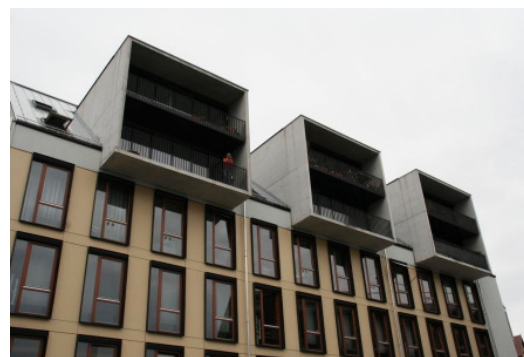
PraxisLabor Reutlingen, Lederstraße 126